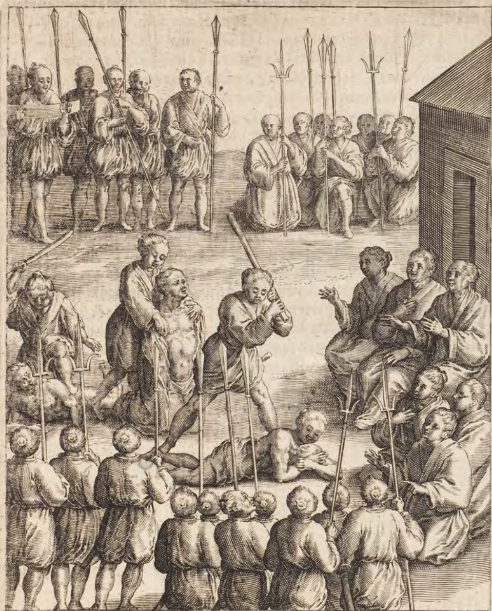
ARIMÆ IN CHRISTIANOS ATROCITER SEVITVR.