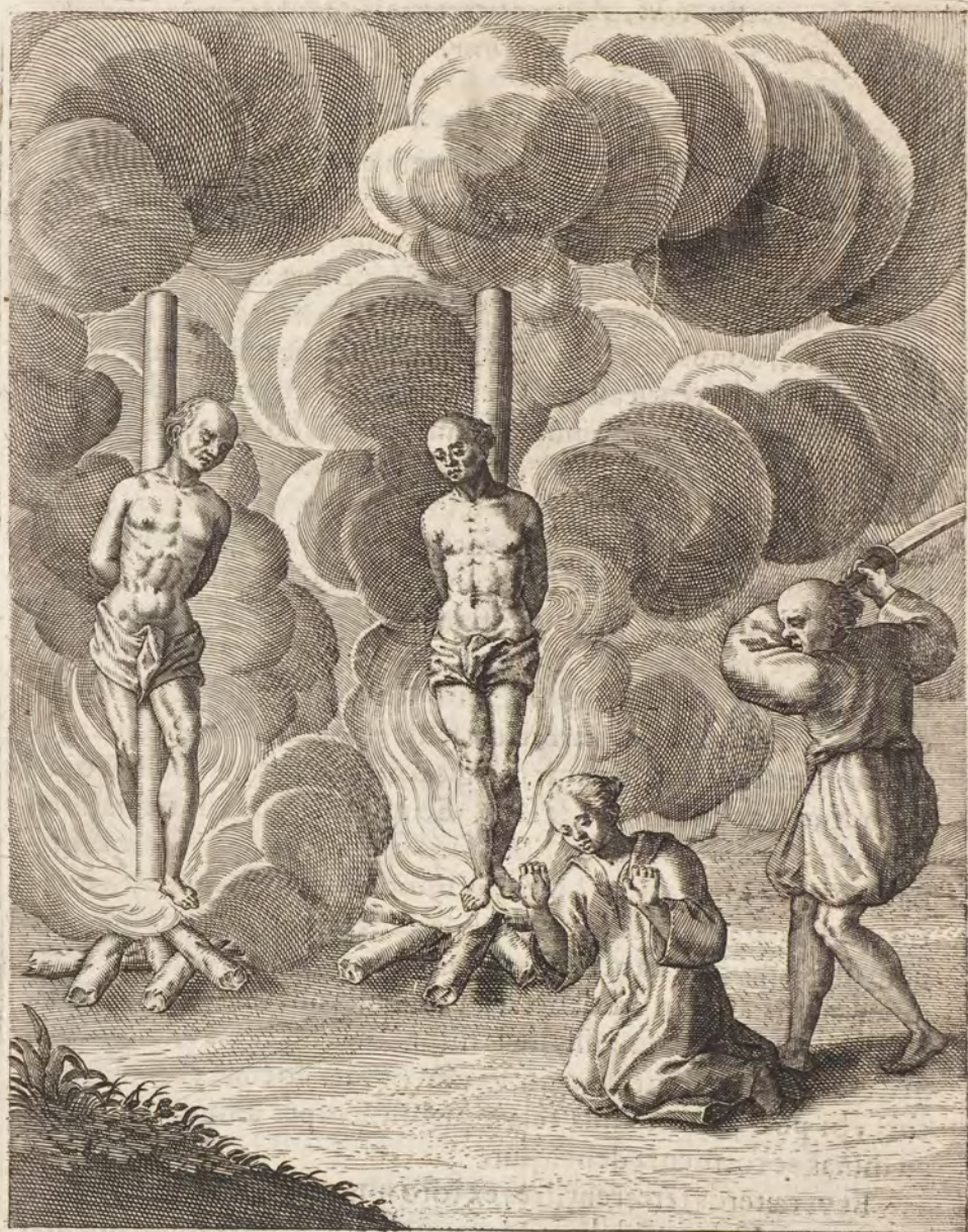
MICHAEL ET LINVS EXVRVNTVR MAXENTIA TRVNCATVR.