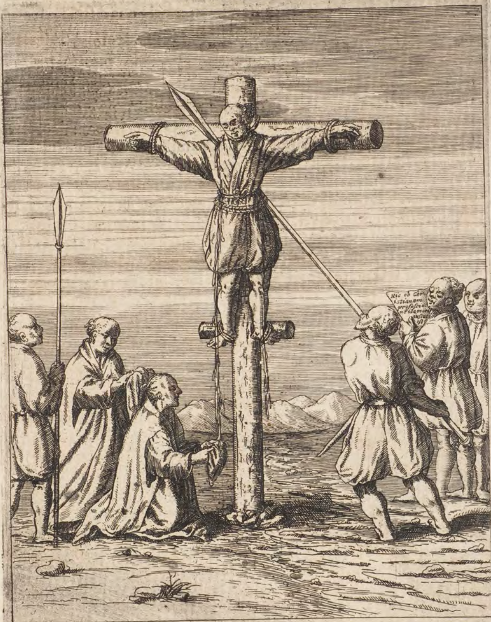
DOMINICVS CHRISTI CAVSSA IN CRUCEM ACTVS.

Denique fixis in cælum oculis cum SS. Iesu ac Mariæ nomina inuocaret, lancea de more quater impetitur, & in sui sanguinis fluuio in cælestem portum anima deportatur, eo ipso die & anno, quem dixi, cum ageret ille ætatis 23. vel 24. in professione verò fidei Christianæ vix octauum, mox vt fluere cæpit sanguis, concurrere neophyti, neque à satellitibus, quin magnam illius partem exciperent contineri potuerunt. Corpus verò non nisi post octiduum quo toto excubitores adhibiti, sacrum furtum vetuerunt, de eo rapiendo consilia inierunt, & iam perfecerunt, Firoximamque suam sacro hoc pignore nobiliorem reddiderunt.