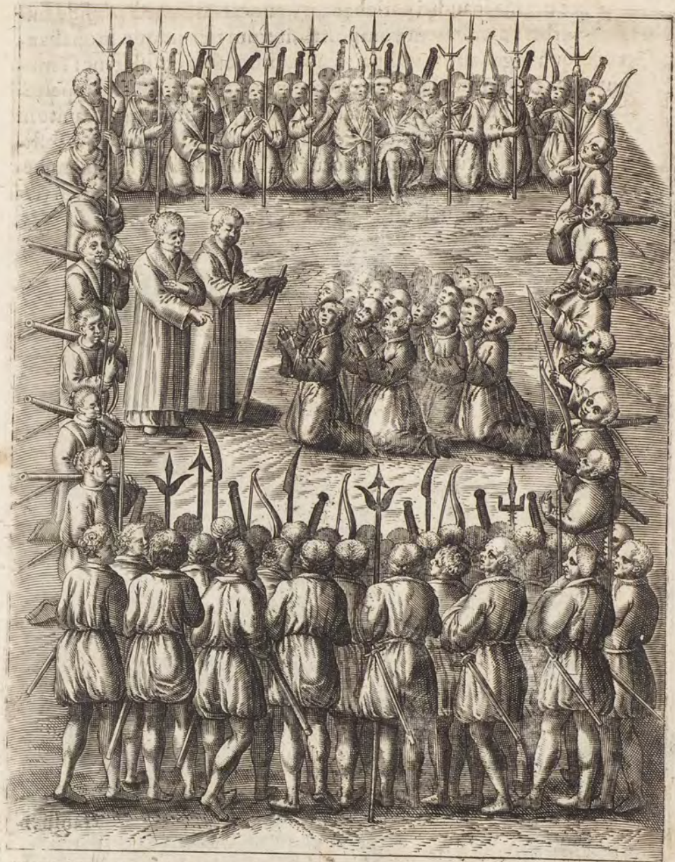
CHRISTIANI CORONA MILITVM CINCTI ET POSTEA INTERFECTI