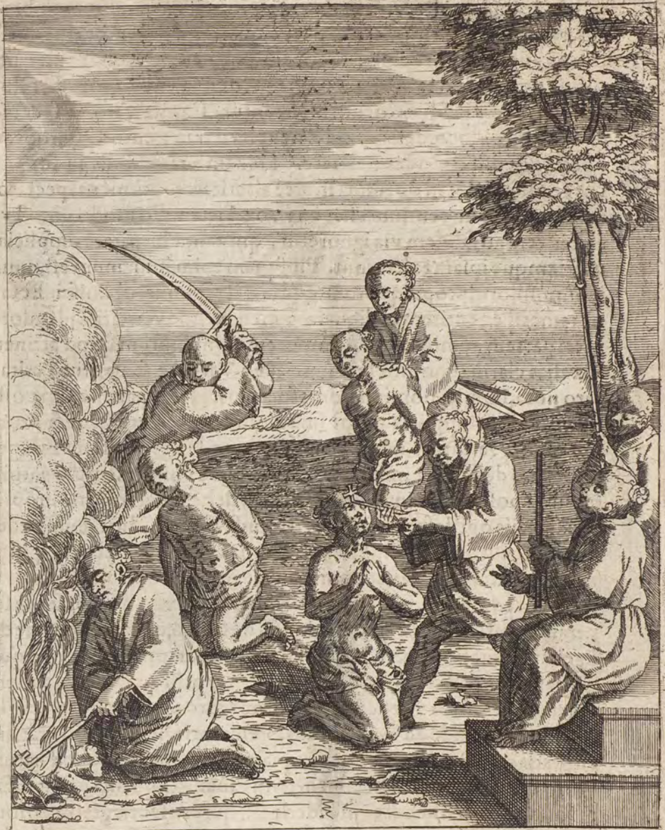
CANDENTI FERRO IN FORMAM CRVCIS FRONTIBVS INVRVNTVR.