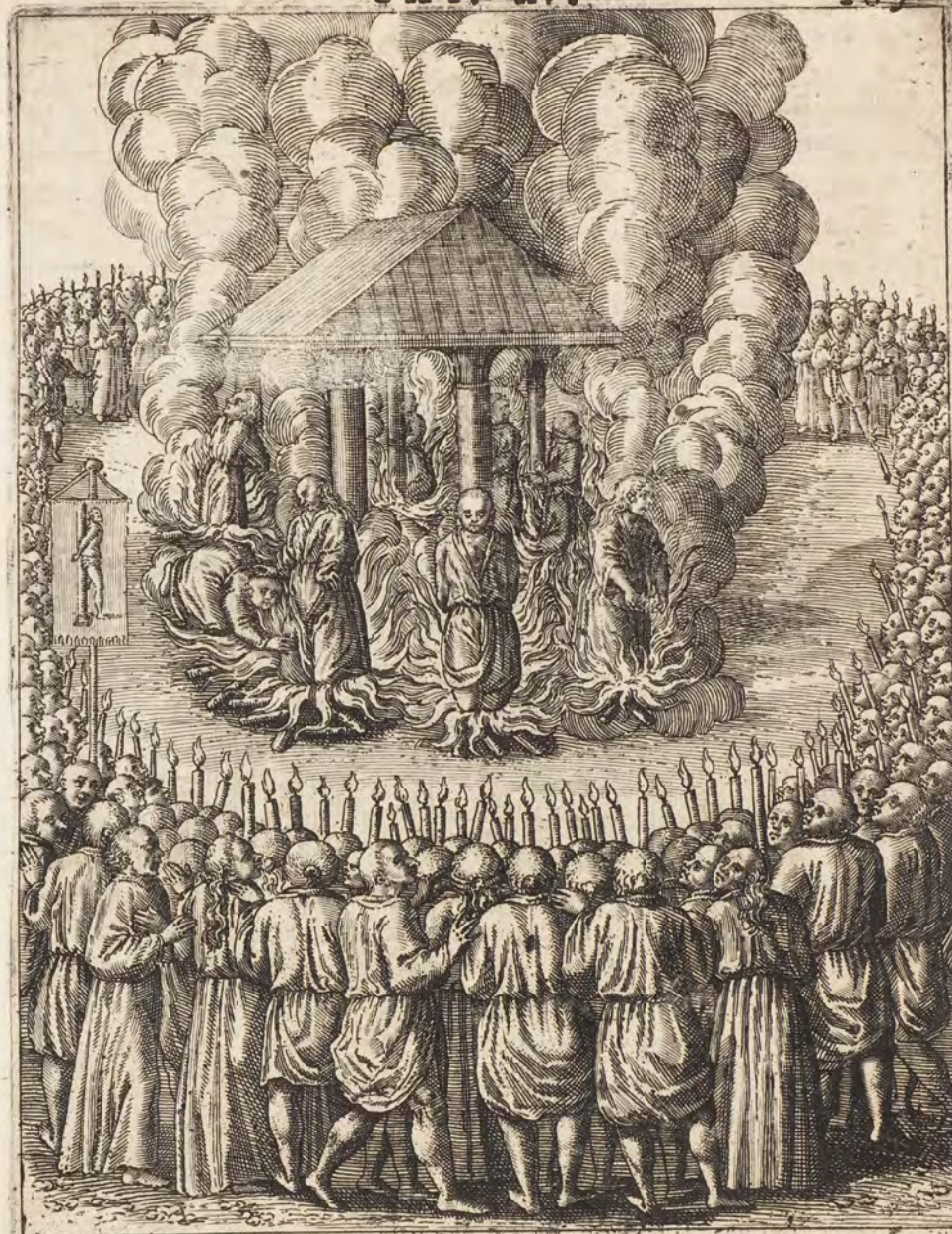
OCTO CHRISTI VICTIMÆ VIVÆ CONCREMANTVR.