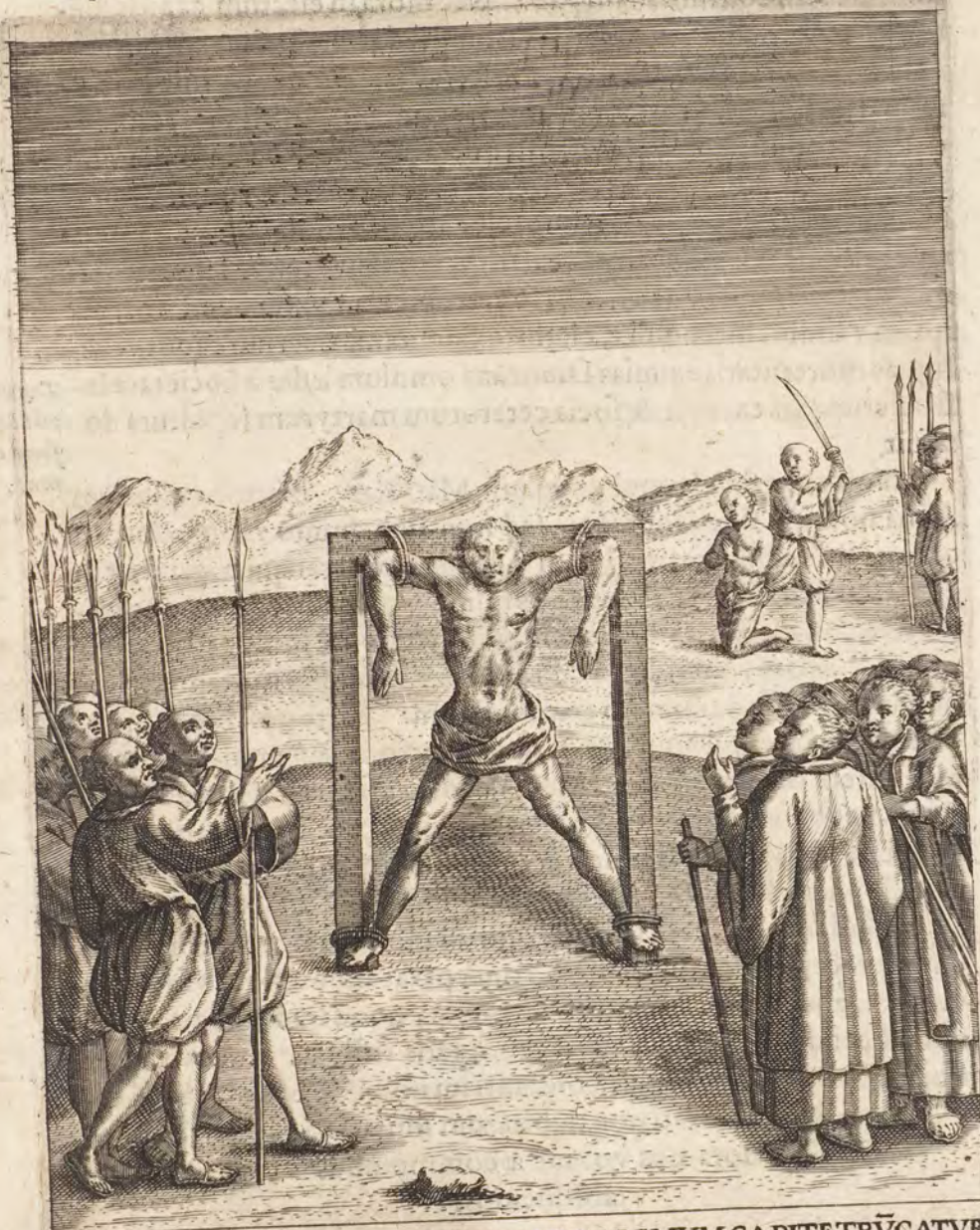
ADAM ARACAUA NVDVS PENDET ET DEMVM CAPITE TRVCATVR.