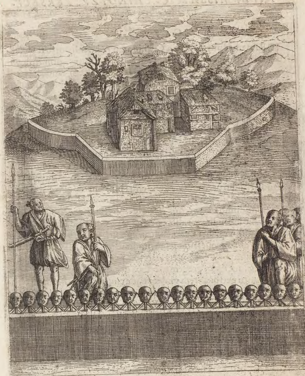
VIGINTI MARTYRVM CAPITE SVSPENSA.