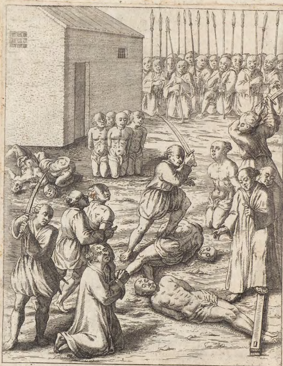
CRVRA MARTYRVVM INTRA TRABES COMPRIMVNTVR.