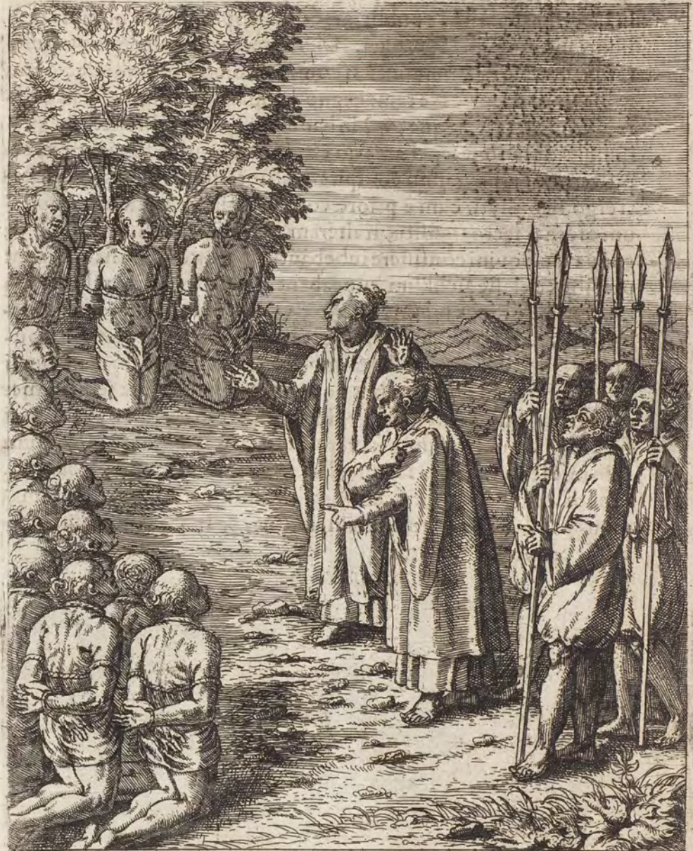
SEPTVAGINTA NEOPHYTI SAFIOYE SE VLTRO AD MARTYRIVM OFFERVNT.