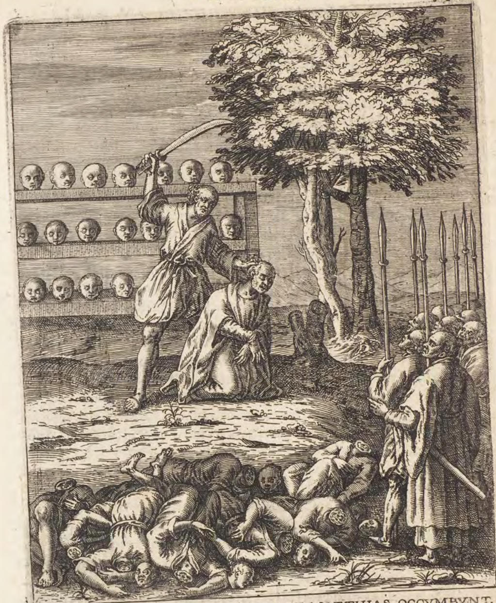
MICHAEL ET MATTHIAS, THOMAS ET MATTHIAS OCCVMBVNT. lib. 1. c. 19. lib. 2. c. 2.