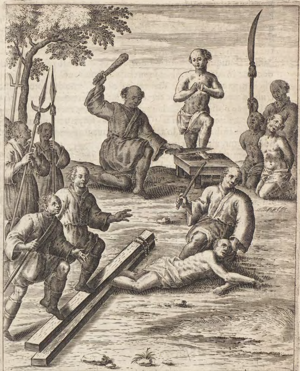
TIBIA INTRA TRABES PERSTRICTA MANVS PEDESQ̄ TRV̄CATVR

CHRISTIANI ALIBI PEDIBUS IN TERGVN REVICITIS HORSO GRASHI SAXI MORTO SVBIVNTVR