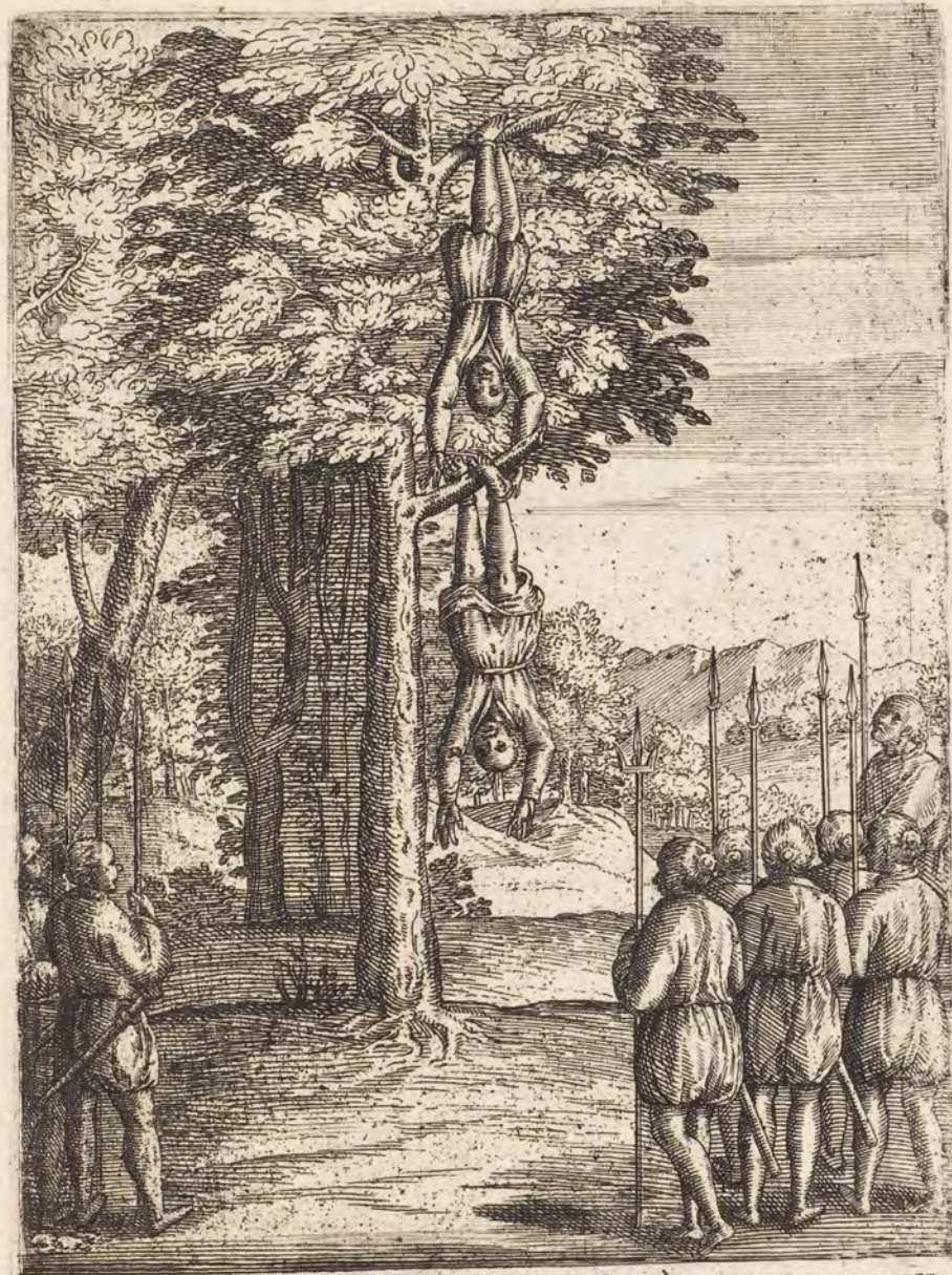
IOACHIMVS ET TOMAS CAPITE PRIMVM ENVERSO SVSPENSI DEMVM OBTRVNCATVR.